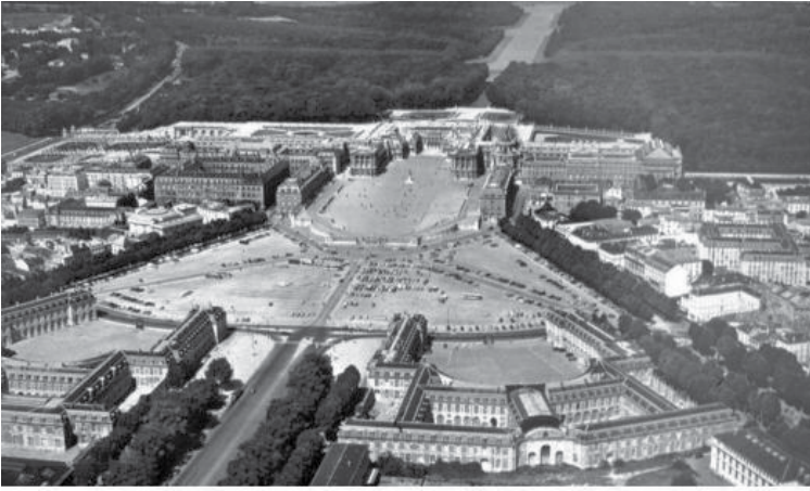
사진 속의 궁전은 “역사 이래 가장 화려한 궁전을!”이라고 외친 태양왕 루이 14세의 명령에 따라 프랑스가 수십 년간 총력을 기울여 만든 총 길이 680미터의 베르사이유 궁전입니다.

원래 이 궁전 자리는 늪 지대였는데 막대한 양의 흙을 끌어다가 토대를 다지고 삼림을 옮겨 심었습니다. 또 분수를 만들기 위해 강의 흐름을 바꾸고, 거대한 펌프를 사용하여 센 강의 물을 15미터나 끌어 올리는 등 대대적으로 자연을 개조해 놓았지요. 그리고 내실 바닥에서부터 천장의 못 하나까지도 할 수 있는 모든 치장을 다하여 궁전을 건설했습니다. 그래서 베르사이유 궁전은 지금도 꿈의 궁전으로 불립니다. 이보다 더 아름다운 집이 있을까요?