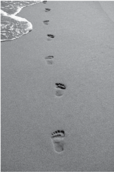
모래 위의 발자국 / 메어리 스티븐슨

어떤 사람이 꿈을 꾸었습니다. 주님과 함께 해변을 걷고 있는 꿈이었습니다. 하늘 저편에 자신의 인생의 장면들이 번쩍이며 비쳤습니다. 한 장면씩 지나갈 때마다 그는 모래 위에 새겨진 두 쌍의 발자국을 보았습니다. 하나는 그의 것이고 다른 하나는 주님의 것이었습니다.