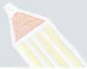
그림 보고 노랫말 바꾸기