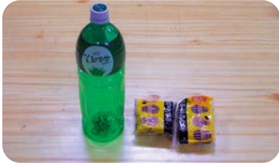
① 준비물을 준비해요.