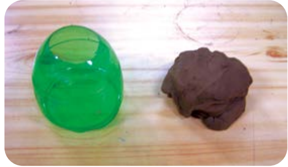
② 페트병 윗 부분을 잘라요. (위험하므로 어른께 부탁해요.)