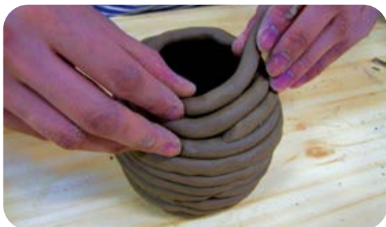
⑦ 항아리를 뒤집어서 윗부분을 만들어요.