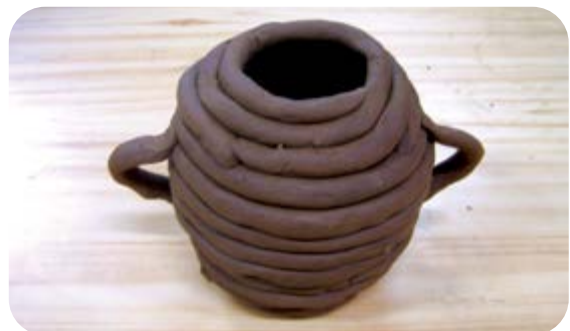
⑧ 손잡이를 만들고 항아리를 완성해요.