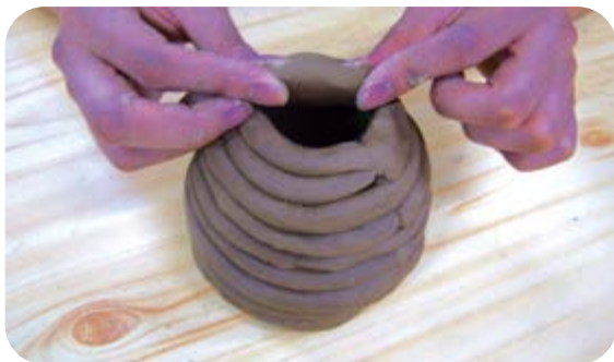
⑤ 항아리 바닥을 만들어서 덮어요.