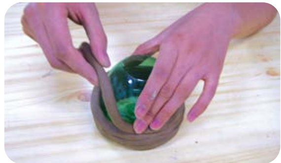
④ 찰흙을 페트병의 아래 부분부터 붙여 나가요.