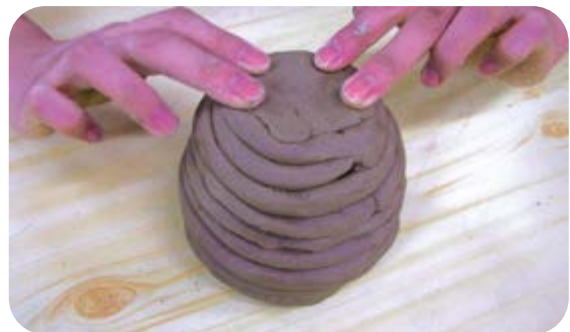
⑥ 항아리 바닥을 막았어요.