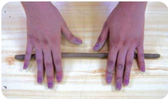
③ 찰흙을 동그랗고 길게 말아요.