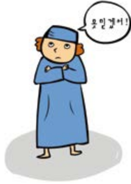
② 하나님의 약속을 믿지 않아서