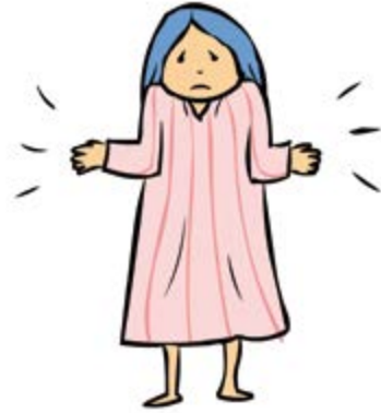
③ 아이들이 없어서

2. 이스라엘 백성이 하나님께 구원해 달라고 기도했을 때, 하나님께서 보낸 사람을 무엇이라고 부르나요?