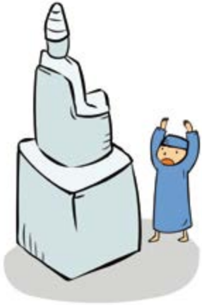
① 우상을 섬겨서

1. 이스라엘 백성이 괴롭힘을 받은 이유가 아닌 것은 무엇인가요? ( )