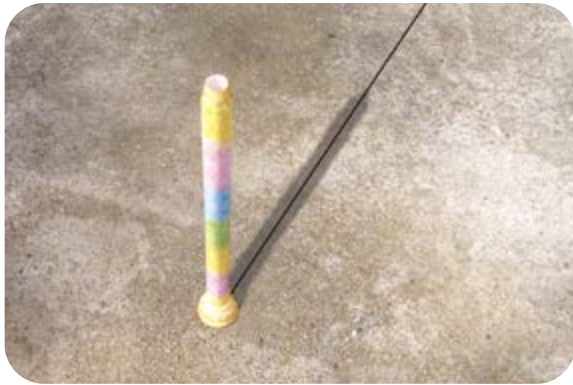
여러 시간 후에 막대기 그림자 끝을 표시하세요.

날씨가 맑은 날 해가 비치는 곳에 막대기를 세우세요. 막대기에 생긴 그림자의 끝을 찾아서 동그라미로 표시하세요.