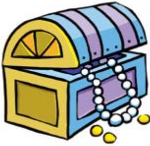
① 보물 상자