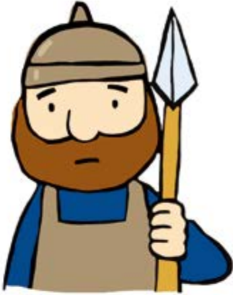
① 이스라엘 군사

1. 아람 군대가 모두 도망갔다는 사실을 성에 알려준 사람은 누구였나요? ( )