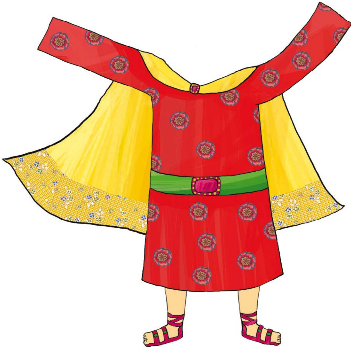
61쪽 아들 꾸미는 종이