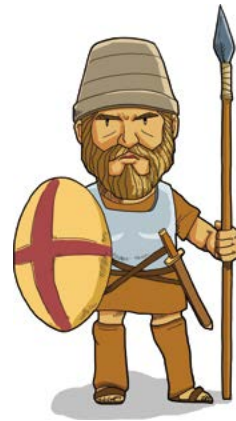
우리가 우리 하나님께