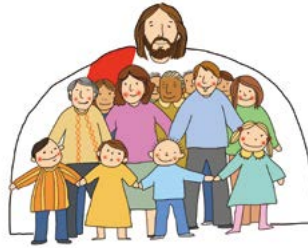
(고린도전서 1:2, 3:16)