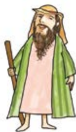
나도 저렇게 은유한 사람이 되어야겠다.