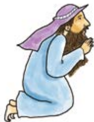
아! 나도 저렇게 기도해야겠다.