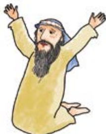
나도 저렇게 이스라엘 백성들을 위해 기도해야지.