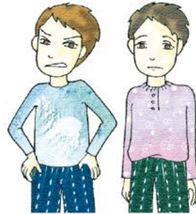
친구는 욕을 했지만 나는 욕하지 않는다.