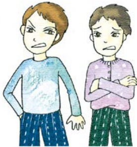
친구가 욕을 하면 같이 욕한다.

솔로몬은 이방 여인들을 따라 우상을 섬겼습니다. 이것은 하나님께 큰 잘못을 한 것입니다. 나에게도 솔로몬과 비슷한 모습이 있는지 생각해 보아요.