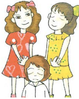
따돌림 시키는 친구와 덩달아 따돌림 시킨다.