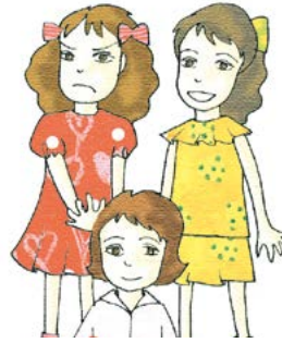
따돌림 시키는 친구를 말린다.

나도 위의 아이들처럼 친구의 옳지 못한 행동을 따라서 한 적이 있는지, 아니면 어떻게 했는지 적어 보세요.