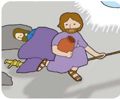
사울이 하길라산 길가에 진 쳤을 때