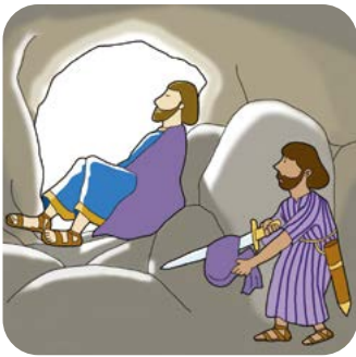
사울이 엔게디 황무지의 굴 속으로 들어왔을 때

사울이 군사를 이끌고 다윗을 죽이려고 왔을 때 다윗은 어떻게 했는지 대답해 보세요.