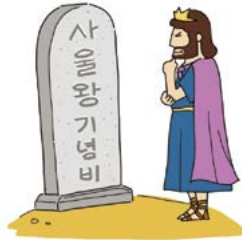
자기를 위해 기념비를 세운 것