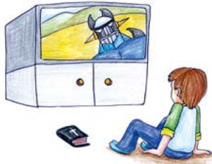
TV나 보자! 머릿돌, 암송만 잘하면 아마 하나님께서 좋아하실 거야!