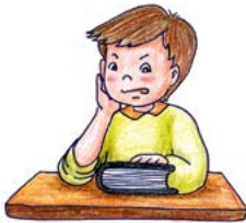
하나님께서 항상 말씀을 가까이 하라고 하셨는데...