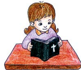
난 매일 성경을 읽을 거야! 하나님께서 말씀을 가까이 하라고 말씀하셨거든!

2. 여러분이 하나님께 순종하고 있는 것을 적어 보세요. 그리고 선생님이나 친구들과 함께 교제해 보세요.