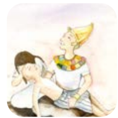
장자 죽는 재앙

4. 하나님께서 애굽에 재앙을 내리실 때 이스라엘 백성들이 살고 있던 고센 땅에는 재앙이 내리지 않았습니다. 하나님께서 이스라엘을 구별하며 애굽에 내리신 재앙을 찾아보세요.