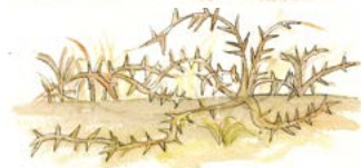
가시와 엉겅퀴가 난다.