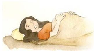
자식을 낳는 고통