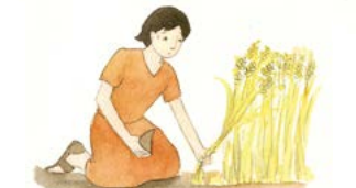
땅에서 수고하고 일해야 한다.