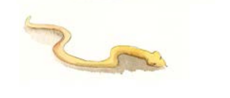
땅에서 배로 기어 다녀야 한다.

아담과 하와의 부끄러움을 가려주신 것처럼 하나님께서는 을 보내주셔서 우리의 죄를 가려주시고 구원해 주셨습니다.