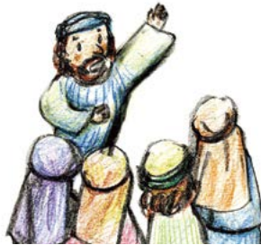
예수님의 말씀대로 사람들에게 부지런히 말씀을 전파했어요.