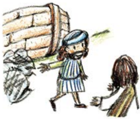
예수님께서 부르셨을 때, 기쁜 마음으로 따라갔어요.