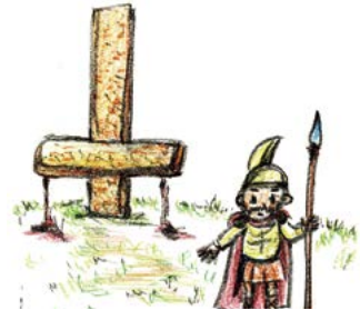
말씀을 전하다가 십자가에 거꾸로 못박혀 죽임을 당했어요.

? 베드로는 예수님께서 부르셨을 때 따랐고 예수님을 사랑하였기 때문에 최선을 다해서 말씀을 전 파했습니다. 예수님께서 제자들을 부르신 것처럼 우리도 부르셨습니다. 우리의 미래를 그림으로 그려보고 써 보세요.