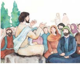
전도하기 위해서 기도하신 예수님

예수님께서서는 언제 기도하셨나요? 말씀을 찾아 읽고 알맞은 그림과 연결해 보세요.