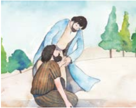
제자들을 부르기 위해 기도하신 예수님