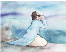
하나님뜻에 순종하기 위해 기도하신 예수님