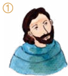
천사를 불러 마귀를 물리치셨다.