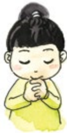
① 기도할 때