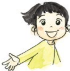
⑤ 기쁠 때