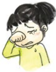
② 슬플 때