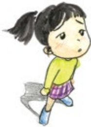
④ 외로울 때