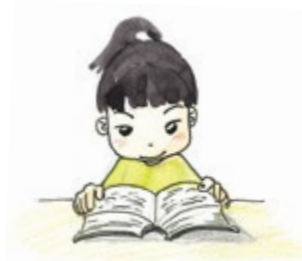
③ 말씀을 읽을 때