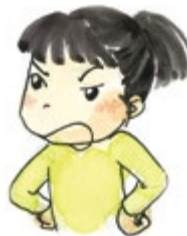
⑥ 욕하며 거짓말할 때