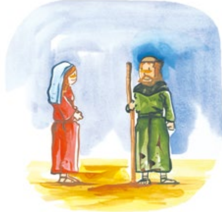
여기서 쉬어 가세요.