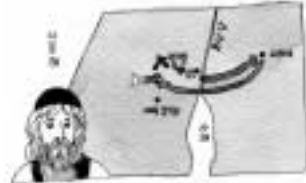
사무엘상 7:3, 4